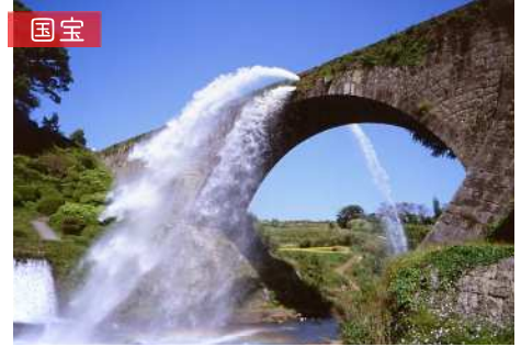
▲通潤橋 石造りアーチから勢よく水が吹き上がる、日本を代表する水路橋

山都町は熊本県の東部、九州のほぼ中央に位置する町です。阿蘇南外輪山や九州脊梁の山々に囲まれ、山から生まれた清らかな水が川となって町を流れています。深谷や滝棚田など、自然の表情が身近に広がり、山や川を生かした散策やレジャーを楽しめるのも山都町の魅力です。四季折々に変わる風景の中で、自然とともにある暮らしが息づいています。