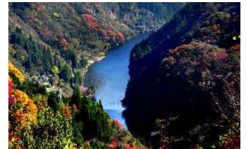
▲蘇陽峡 「九州のグランドキャニオン」と呼ばれる深谷美