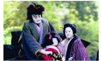
▲清和文楽 人形と語りが織りなす、伝統の人形浄瑠璃