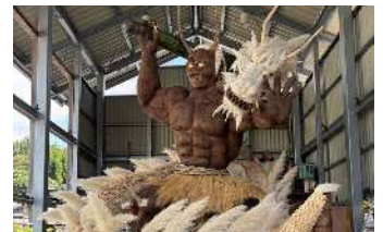
▲八朔祭 自然の素材からできた迫力ある大造り物が練り歩く