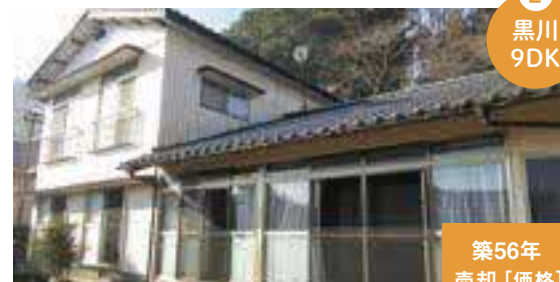
駅や病院に近い立地 人数の多い世帯におすすめ!