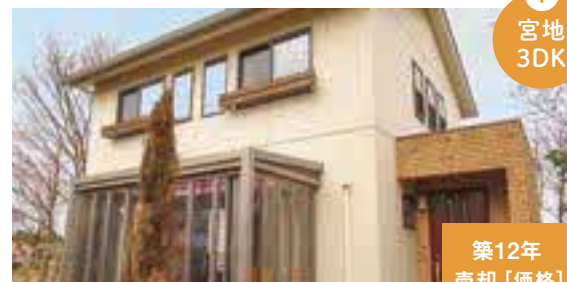
阿蘇山の麓に位置する 家具・温泉付き物件