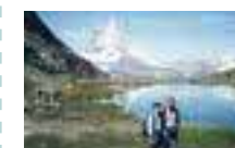
趣味はハイキング。これまで長野県の南アルプスやスイスのマッターホルンなど、各地の山々を巡りました。