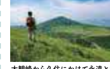
大観峰から久住にかけて永遠と続く美しい草原。初めて見た時の感動は、今でも忘れられません。