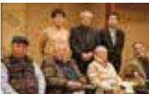
阿蘇在住の写真愛好家が集まる「阿蘇写真会」で活動しています。40歳以上年の離れた友人ができました。