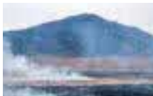
「草千里ヶ浜」の草原。僕が週末働いている「ニュー草千里」内の展望レストランからの眺めも最高です。