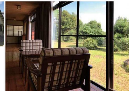
きくち暮らし お試しハウス