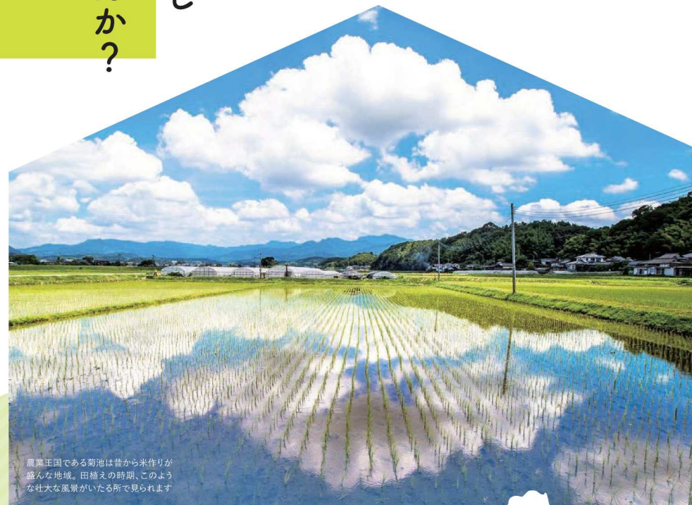
農業王国である菊池は昔から米作りが盛んな地域。田植えの時期、このような壮大な風景がいたる所で見られます